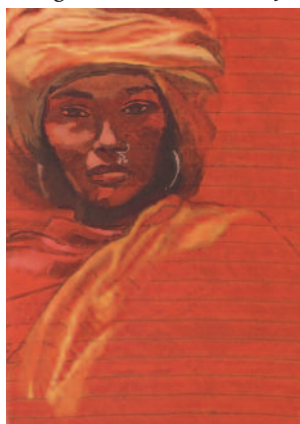
Bibi, artiste de l'Unesco pour la paix