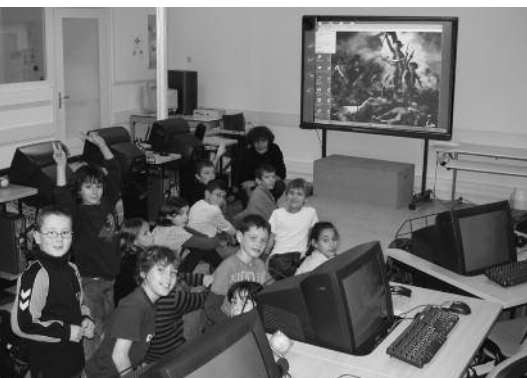
Les jeunes devant l'écran numérique dans la salle informatique

● L'année scolaire a bien débuté pour l'école élémentaire. La baisse des effectifs s'est hélas confirmée et nous accueillons désormais 82 élèves.