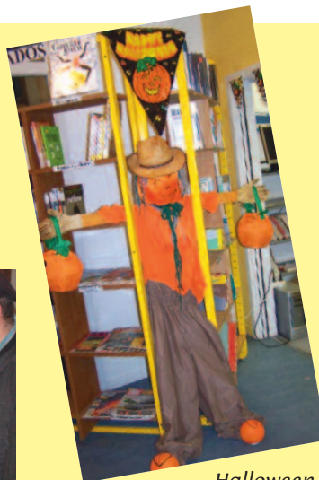
Halloween et Titouan LAMAZOU... à la MÉDIATHÈQUE