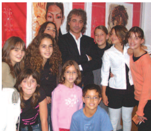
Titouan avec nos jeunes... futurs modèles ? L'artiste a promis de revenir à Luzech après son long séjour au Mexique pour peindre des... "Femmes de Luzech".

« Pour dépeindre le monde tel qu'il est, il est plus représentatif de le faire à travers des portraits féminins » nous a-t-il déclaré en nous présentant ses magnifiques « livres d'images », ses peintures, photos et textes qui firent le bonheur des visiteurs de la Médiathèque jusqu'à Noël. Avec, notamment, sa dernière série intitulée « Femmes du monde » qui traduit avec un rare bonheur son engagement sans prétention pour témoigner de notre humanité, de la Mauritanie, au Pôle nord, en passant par le Brésil et la Palestine... Il atteste d'une sensibilité d'artiste écorché et d'une rigueur ethnologique épurée. On ne s'étonnera pas qu'il ait été nommé « Artiste pour la Paix de l'Unesco ».