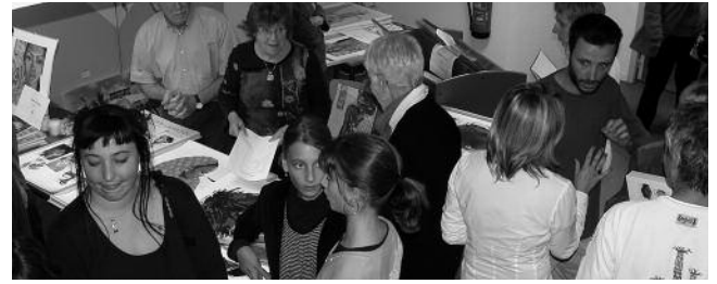
L'exposition, la boutique et la séance de dédicaces eurent beaucoup de succès.

Cette belle journée fut clôturée par une réception offerte par la Mairie de Luzech, à laquelle étaient présentes les personnalités du Département et de la Région.