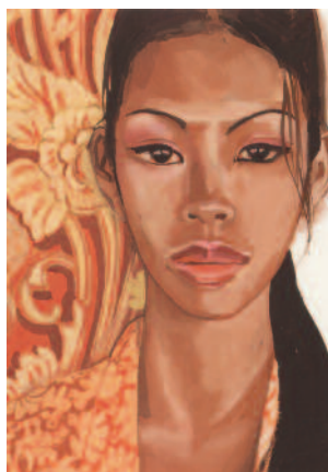
Dayu, princesse balinaise