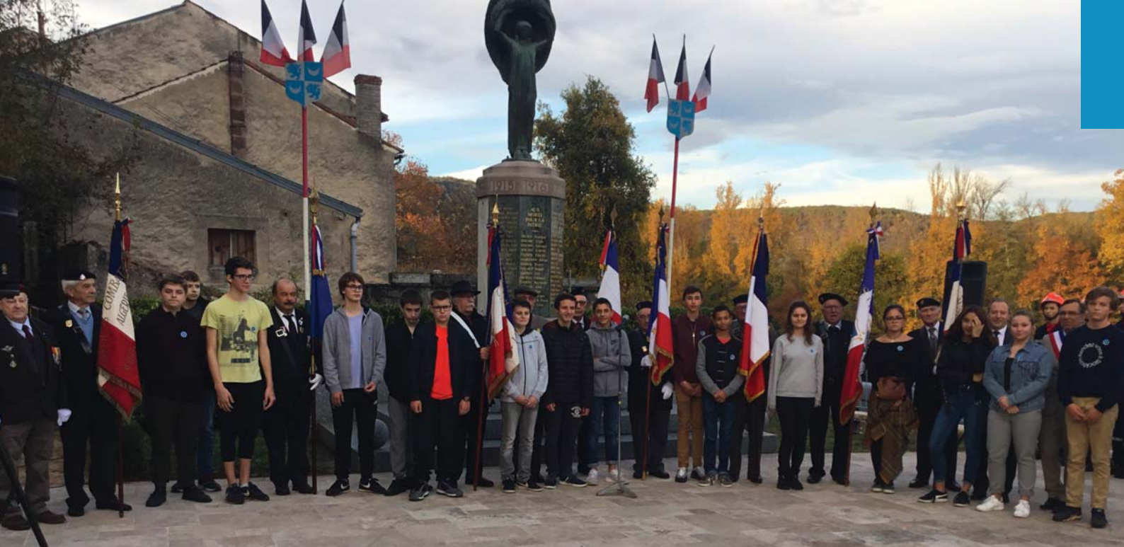
Des élèves de 3 e présents lors de la commémoration du 11 novembre

Tous ces monuments se rejoignent sur un point : conserver le nom, la mémoire de chacun des morts de la commune. Ils sont le lien entre le monde des morts et le monde des vivants. Lien marqué par la cérémonie du 11 novembre et sa liturgie républicaine.