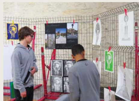
Les travaux des élèves de 3 e exposés le 11 novembre à la Salle La Grave