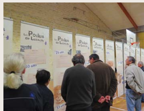
Exposition sur les Poilus de Luzech à la Salle La Grave, le 11 novembre