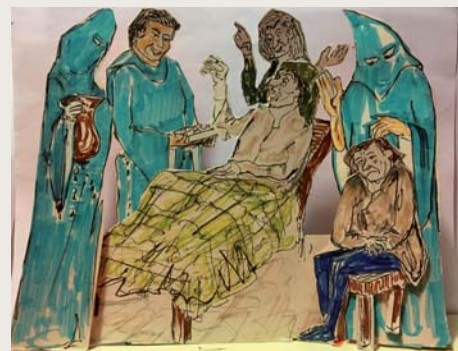
Bas-relief des Pénitents bleus (confrérie catholique qui secourait les pauvres et les miséreux à l'époque médiévale)

Actuellement, Pierre Salgues et Géraud Garrigue participent à la réalisation d'un bas-relief, grandeur nature, à la Chapelle des Pénitents, rappelant l'histoire des Pénitents Bleus.