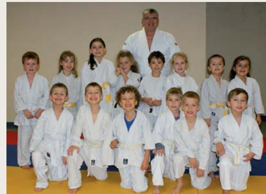
les jeunes judokas de Luzech

Alors n'hésitez pas à venir nous voir, nous nous ferons un plaisir de vous accueillir !