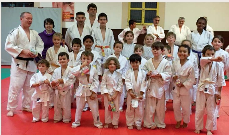
fête des anniversaires entre judokas

Alors n'hésitez pas à venir nous voir, nous nous ferons un plaisir de vous accueillir !