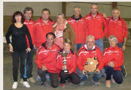
LUZECH vainqueur de la coupe du LOT

Cette saison 2016 s'achève en apothéose avec la victoire finale de la Coupe du LOT , trophée remporté face à la Pétanque Cadurcienne sur ses terres après avoir successivement éliminé aux tours précédents les clubs de Trespoux, Concorès, Sauzet et Vers.