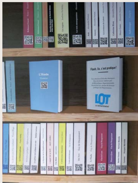
extrait de l'affiche « Lis tes classiques ! »

La difficulté d'étendre les horaires tient du fait qu'il nous faut assurer, en dehors de ces créneaux, tout le traitement des collections : la réservation des livres auprès de la Bibliothèque Départementale de Prêt (BDP), les achats, le catalogage informatique et le rangement des documents, etc. L'aide des bénévoles de l'association Lire à Luzech est précieuse, et je tiens à les remercier.