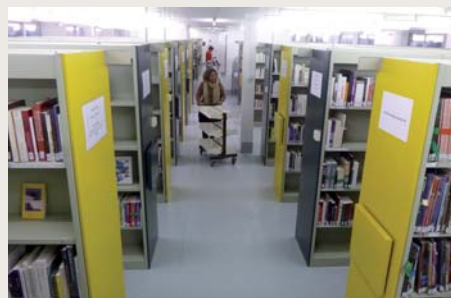
les collections de la BDP

Pour les projets à venir en 2017 ? Une exposition sur le jardin écologique (avec des surprises avec l'association Lire à Luzech!), un nouvel album à découvrir avec bébé autour de l'opération Premières Pages en partenariat avec la