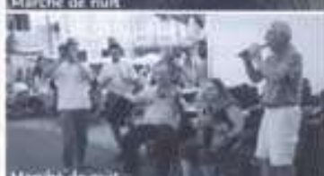
Marché de nuit