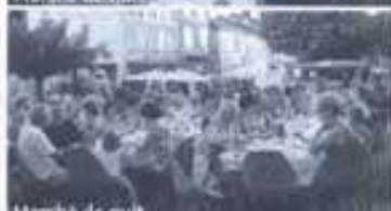
Marché de nuit