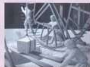
Une roue de carrier, dans les carrières de Paris (XIX e siècle)

durant trois jours et demi à l'espace Clément Marot à Cahors.