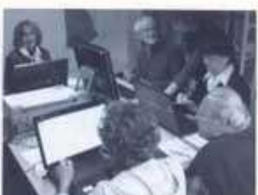
Initiation à l'informatique