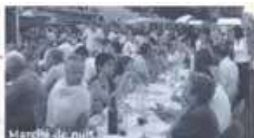
Marché de nuit

Toute l'équipe de l'Office de Tourisme vous donne rendez-vous en 2010 pour continuer à promouvoir le terroir et à proposer des animations pour le village.